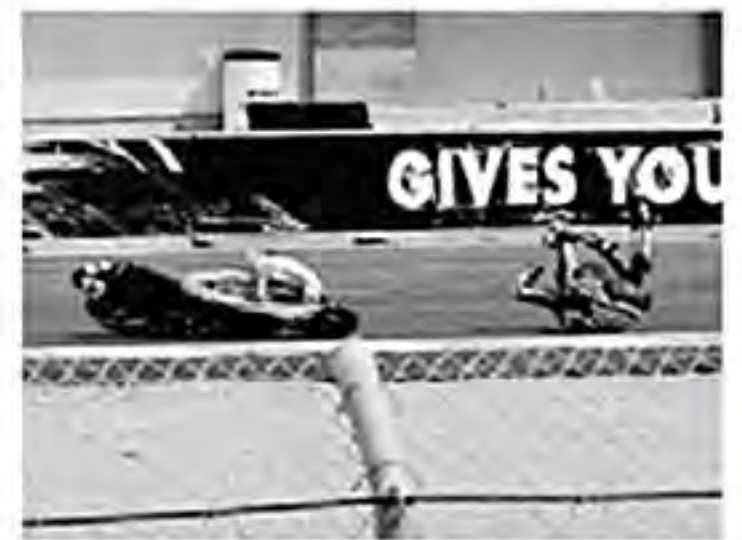
Tomás salió disparado de la moto y por el pavimento rodó algunos metros. Parecía un experto en caídas.