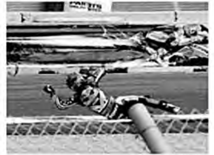
Cuando terminó su recorrido de inmediato fueron a auxiliarlo, pero el colombiano se paró y siguió en la competencia.